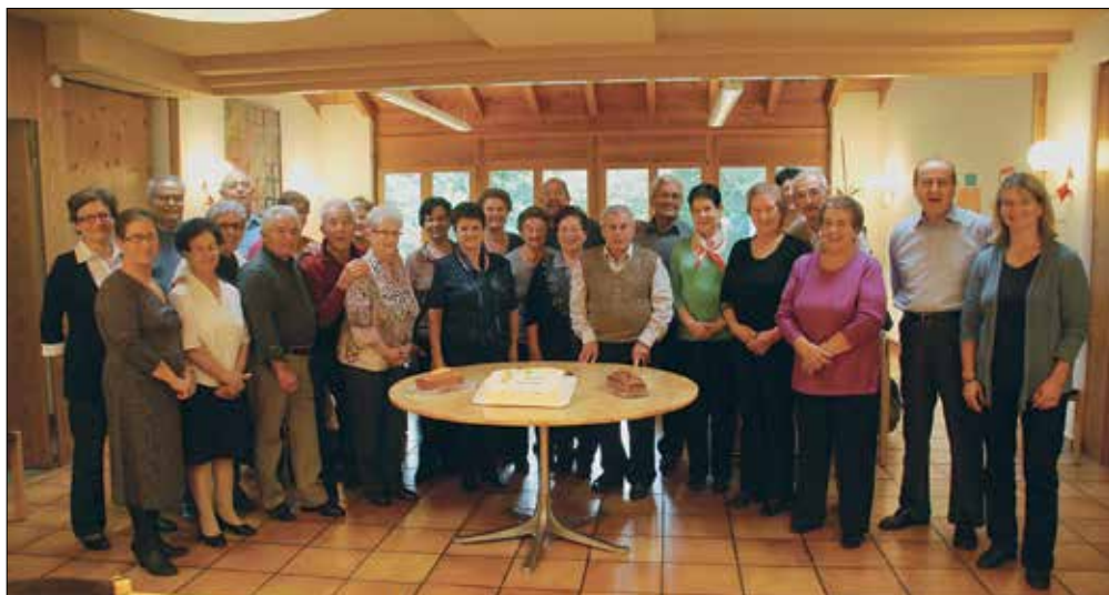
Nella foto d'archivio: l'incontro dello scorso settembre 2012 degli anziani ad Azmos.